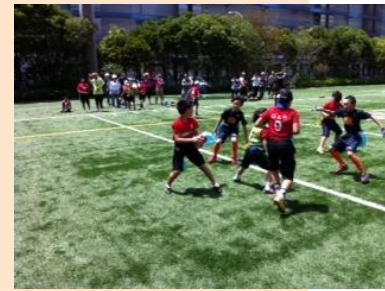
夏と春に各1回ずつ1DAYのフラッグフットボール大会を行いました。