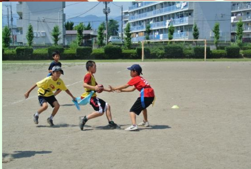
新たに4クラブ設立とフットボールの技術指導教室も行いました。