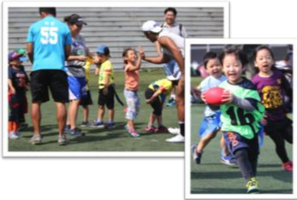
【フラッグフットボール体験会】