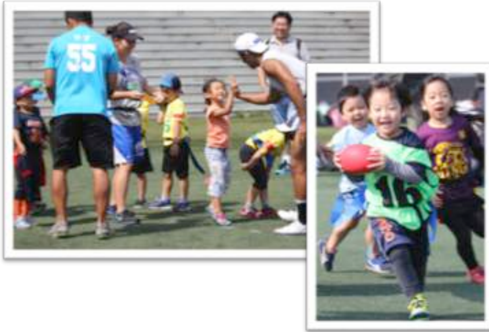
【フラッグフットボール体験会】