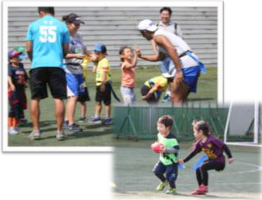
【フラッグフットボール体験会】