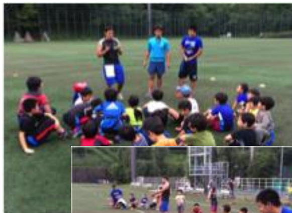
【フラッグフットボール体験会】